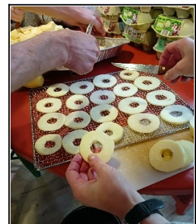
Photo : Transformation des pommes pour les faire sécher et les vendre.

Des ateliers de transformation tous les mardis et vendredis après-midi. Les bénévoles valorisent les produits récoltés abîmés en : confitures, soupes, coulis de tomates, compotes, fruits séchés, etc. Cela nécessite une phase de tri, puis de les éplucher, de les couper, de les cuisiner et enfin de les mettre en pot ou bouteille après stérilisation. Une dernière phase consiste à refroidir les soupes et les coulis pour finir de les stériliser puis à étiqueter tous les produits fabriqués.